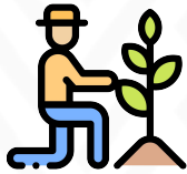
Giros del sector primario (agricultura, ganadería)